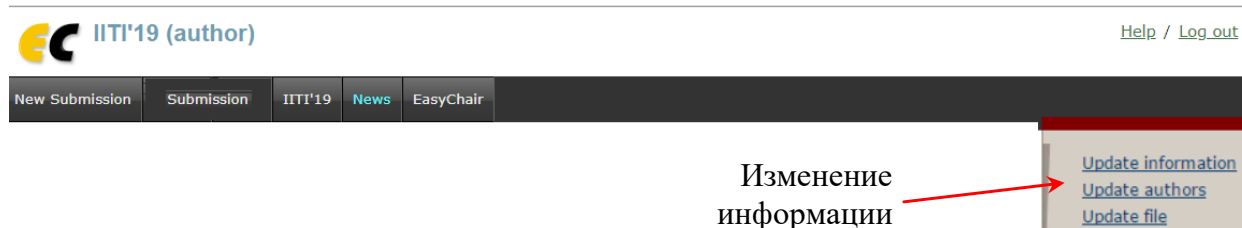
Рис. 12. Вкладка правки данных

Шаг 4. Если Вы хотите подправить данные о статье (название статьи, аннотацию, ключевые слова), то правом верхнем углу страницы конференции нажмите «Update information» (Обновление информации); подправить информацию об авторах нажмите «Update authors» (Обновление информации об авторах) (рис. 12).